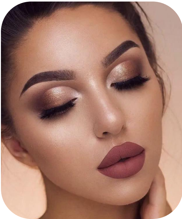
晚宴化妆浓淡程度参考样稿