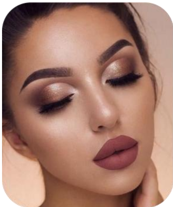
晚宴化妆浓淡程度参考样稿